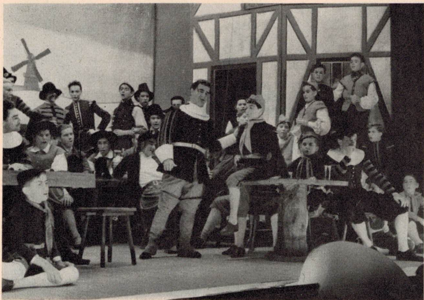
«Zar und Zimmermann»: In der Schenke: «Nun, leb wohl...!»

Externen bei einem von der SBB veranstalteten Filmabend. — Am Fronleichnamsnachmittag sah man sich den zweiten Gotthelffilm «Uli der Pächter» an. Obwohl die Meinungen über die Wirklichkeitstreue auseinander gingen, war festzustellen, daß der Film allen gut gefiel. — «Der Fall Maurizius» des französischen Filmregisseurs Julien Duviver ist ein Fall für sich, da der Film bei gutem Spiel der Darsteller eine makabre Geschichte zum Inhalt hat.